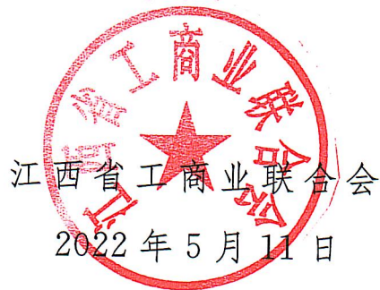
江西省工商业联合会