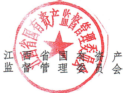
江西省国有资产监督管理委员会