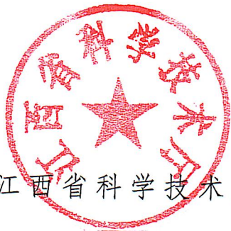
江西省科学技术厅