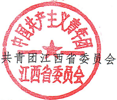
共青团江西省委员会