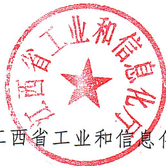
江西省工业和信息化厅